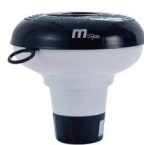
Distributore di prodotti chimici