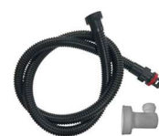
Tubo di gonfiaggio